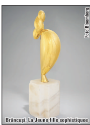
Brâncuși: La Jeune fille sophistiquee