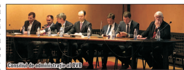
Consiliul de administrație al BVB

Noul plan tarifar al Burselor de Valori București (BVB), implementat de la începutul anului, rămâne în vigoare, după ce acționarii operatorului de piață nu au aprobat, ieri, propunerea de anulare a schemei de taxe, înaintată de Asociația Brokerilor și SIF3 Transilvania. Adunarea Generală Ordinară a