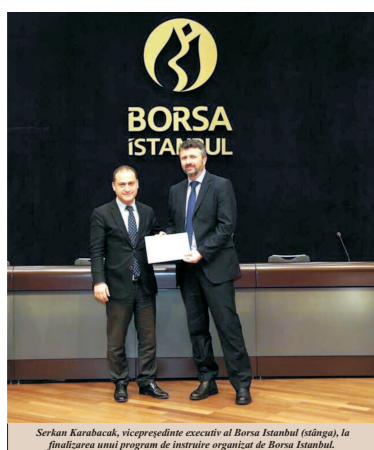
Serkan Karabacak, vicepreședinte executiv al Bursa Istanbul (stânga), la finalizarea unui program de instruire organizat de Bursa Istanbul.

de tranzacționare, lichiditatea, vânzările și profitul bursei în 2018, comparativ cu 2017? Serkan Karabacak: Rezultatele financiare pe trimestrul întâi din acest an nu au fost publicate deocamdată, însă în primele patru luni, volumul de tranzacționare a sporit cu aproape 60% pe piețele de acțiuni. Putem spune că aceste cifre vor avea efecte pozitive asupra vânzărilor și profitului pe 2018. Reporter: Aveți în plan să lansați noi produse de piață în 2018? Serkan Karabacak: Anul trecut, am lansat certificatele reale estate, un instrument emis pentru finanțarea proiectelor imobiliare construite sau care urmează să fie construite. Acestea permit achiziția de locuințe în rate. Mai mult, aceste certificate pot fi cumpărate și vândute prin Bursa Istanbul. Pe lângă certificatele imobiliare, avem certificatele de concesiune și obligațiunile garantate cu aur, care sunt exemple de instrumente financiare islamice.