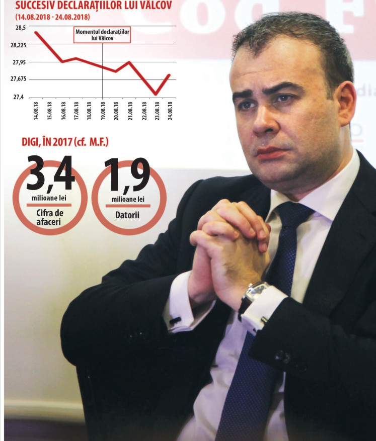
Ilustrație de MAKE

P iața de capital a fost marețată, săptămâna trecută, de o serie de declarații controversate legate de listarea Digi Communications, pomind de la afirmațiile făcute, recent, de Darius Vâlcov, consilier de stat în aparatul de lucru al premierului, care a scris pe pagina sa de Facebook că a întrebat Autoritatea de Supraveghere Financiară (ASF) dacă este adevărat