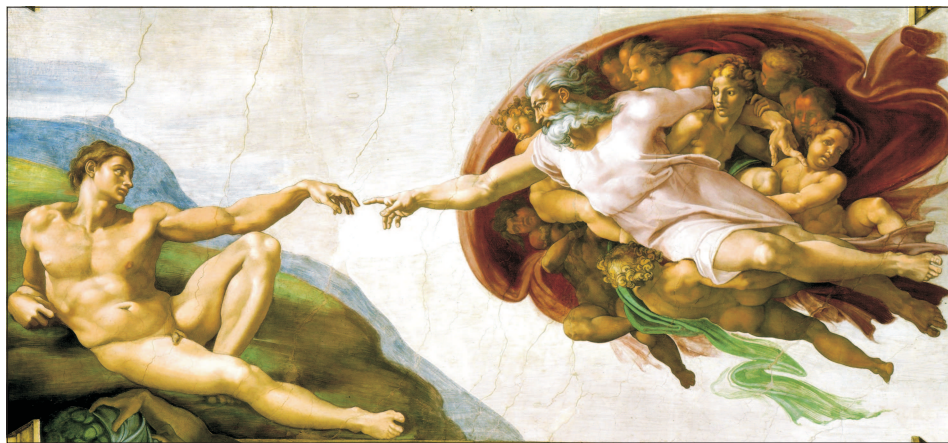
Michelangelo, Capela Sixtină.

O copită zdrăvănită strălucește pe obrazul Bisericii Ortodoxe Române (cum se zice), ceea ce, evident, este o socotală de precupeală. Cu acest scop, Papa a dat publicității "Amoris Laetitia", lucrare în care promovează acceptarea divorțului și a homosexualității, provocând nedumeriri și dispute crâncene în rândul ordinelor religioase. Printr-o coincidență despre care e greu să crezi că este o coincidență, pe timpul celui de-al doilea Sinod (4-25 octombrie 2015) care pregătea "Amoris Laetitia", la 21 octombrie 2015, a avut loc, în România, semnarea documentelor de către Comitetul de Inițiativă al Coaliției pentru Familie, în fața notariului. Colectarea semnăturilor de către Coaliția pentru Familie a fost finalizată la 24 aprilie 2016, iar depunerea semnăturilor și a dosarului de revizuire la Senatul/Parlament a avut loc la 23