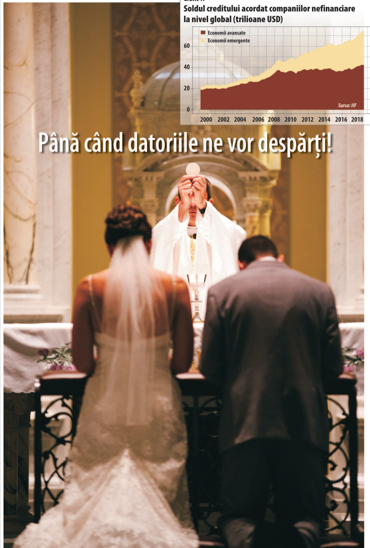
Grafic 1: Soldul creditului acordat companiilor nefinanciare la nivel global (trilioane USD)