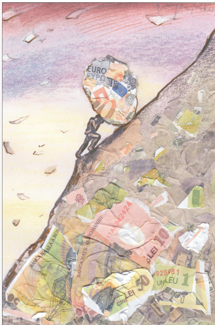
"Sisif 2019" - Grafică de Eugen Mihăilescu

În ultimele zile am asistat la un spectacol grotesc al confruntării dintre Guvern și Banca Națională pe tema deprecierei rapide a leului față de principalele valute. Un comunicat de presă al Ministerului de Finanțe arată că "BNR este instituția care tre-