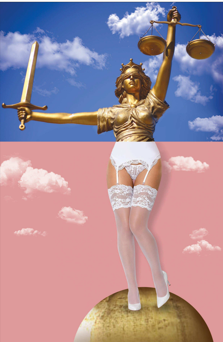
Ilustrație de MAKE

A vertismentul grav venit din partea Comisiei Europene cu privire la statul de drept i-a “surprins” pe oficialii noștri din Executiv. Reuniți la Bruxelles, comisarii europeni au luat atitudine față de ordonanțele de urgență pe care autoritățile de la București le pregătesc pentru modificarea legilor justiției și a legislației penale. Comisia Europeană susține că va acționa în termen de câteva zile dacă guvernul Dăncilă va adopta respectivele acte normative menite să creeze impunitate pentru politicieni cu dosare penale și să slăbească lupta anticorupție.