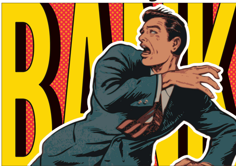
Colaj de MAKE

R iscul ca băncile centrale să conducă economia mondială către o perioadă de stagnare este tot mai evident. Alături de scăderile considerabile ale estimărilor de creștere, cât și așteptările băncilor centrale privind PIB-ul