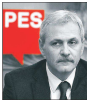
SOCIALIȘTII EUROPENI, SUPĂRAȚI PE COLEGII DE LA BUCUREȘTI

GRAM AUR = 176,9799 RON FRANC ELVEȚIAN = 4,2126 RON EURO = 4,7596 RON DOLAR = 4,2201 RON