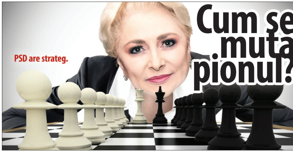
Ilustrație de MAKE

C ongresul PSD a consfințit ceea ce se știa de o lungă vreme: candidatul social-democratilor pentru alegerile prezidențiale din noiembrie este premierul Viorica Dăncilă. Prin urmare, PSD are strateg. Numai că strategia acestuia este neinteligibilă. Nu este înțelesă de nimeni. Fapt care s-a văzut încă de la ședința Comitetului Executiv Național de dinaintea congresului extraordinar al PSD, unde s-a dispus o nouă remaniere guvernamentală.