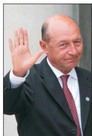
să-mi reproșez. Astea au fost vremurile în care eu am trăit. Nu am ce să comentez. E ușor să dai ceasul înapoi cu 45 de ani. Viața merge înainte. Nu am a comenta. Poate va trebui să fim mai clar în declarațiile de la Înalta Curte". Actualul deputat european a afirmat că va contesta sentința Curții de Apel

Am avut un președinte tumător la fosta Securitate. Cel puțin asta au decis, în primă instanță, magistrații Curții de Apel București, care au stabilit, vineri, că Traian Băsescu a fost colaborator al temutei instituții de reprimare din vremea regimului comunist. În dispozitivul sentinței se arată: "Admite acțiunea. Constată calitatea de colaborator al Securității în privința părții Traian Băsescu Traian. Cu recurs în 15 zile de la comunicare". Verdict a fost pronunțat după ce Consiliul Național pentru Studierea Arhivelor Securității (CNSAS) a stabilit, pe baza unor noi probe, că fostul președinte al țării și-a turnat colegii de facultate, semnând note cu numele conspirativ "Petru". Potrivit CNSAS, Băsescu dădea informații la Securitate despre comportamentul, atitudinea și poziția colegilor săi față de regimul comunist. Înmediat după sentința pronunțată de judecătorii CAB, Traian Băsescu a declarat: "La 21 de ani, habar nu aveam că sunt un departament al Securității, transformându-mă în militar. (...) Nu am ce