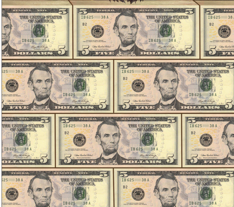
SUA, înglodată în datorii până la gât. Ilustrație de MAKE

D atoria publică a Statelor Unite a ajuns la 1 trilion de dolari în anul fiscal încheiat la 30 septembrie 1981, după o creștere cu circa 81 de miliarde față de anul precedent. Pragul de 2 trilioane a fost depășit în 1986, cel de 4 trilioane în 1992, iar din 2008 situația a scăpat complet de sub control.