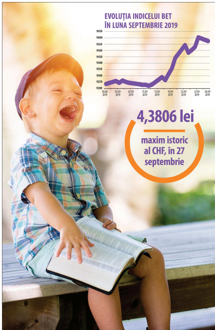
EVOLUȚIA INDICELUI BET ÎN LUNA SEPTEMBRIE 2019