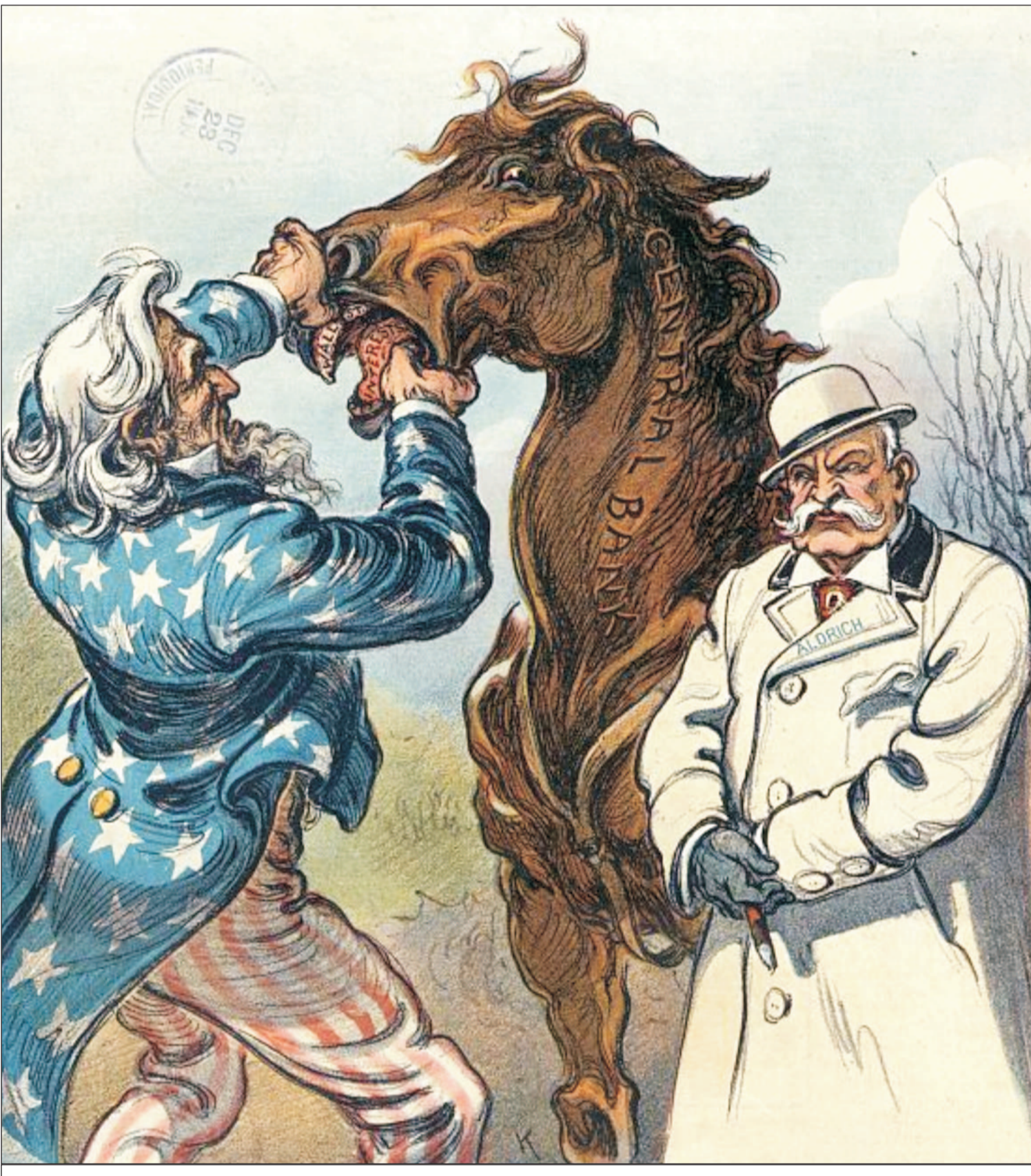
"ÎNTODEAUNA EXAMINEAZĂ DINȚII CALULUI DE DAR" Ilustrația (autor Udo J. Keppler) îl arată pe Nelson W. Aldrich, alături de un cal inscripționat „Banca Centrală”, pe care se pare că îl oferă unchiului Sam, care inspectează dinții calului cu eticheta „Wall St. Interes”. Publicată în Revista Puck, la 1 ianuarie 1909.