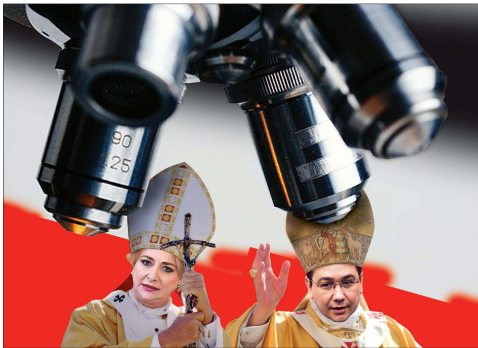
Ilustrație de MAKE

V. V. Ponta și V.V. Dăncilă și-au eliminat trădătorii din partid (pe cei câțiva parlamentari din România și PSD care au votat învestirea Cabinetului Orban), oameni ăștia declară pe față că nu suportă libertatea de opinie în partid, că sub pretextul disciplinei de partid, ei conduc partidele complet ne-