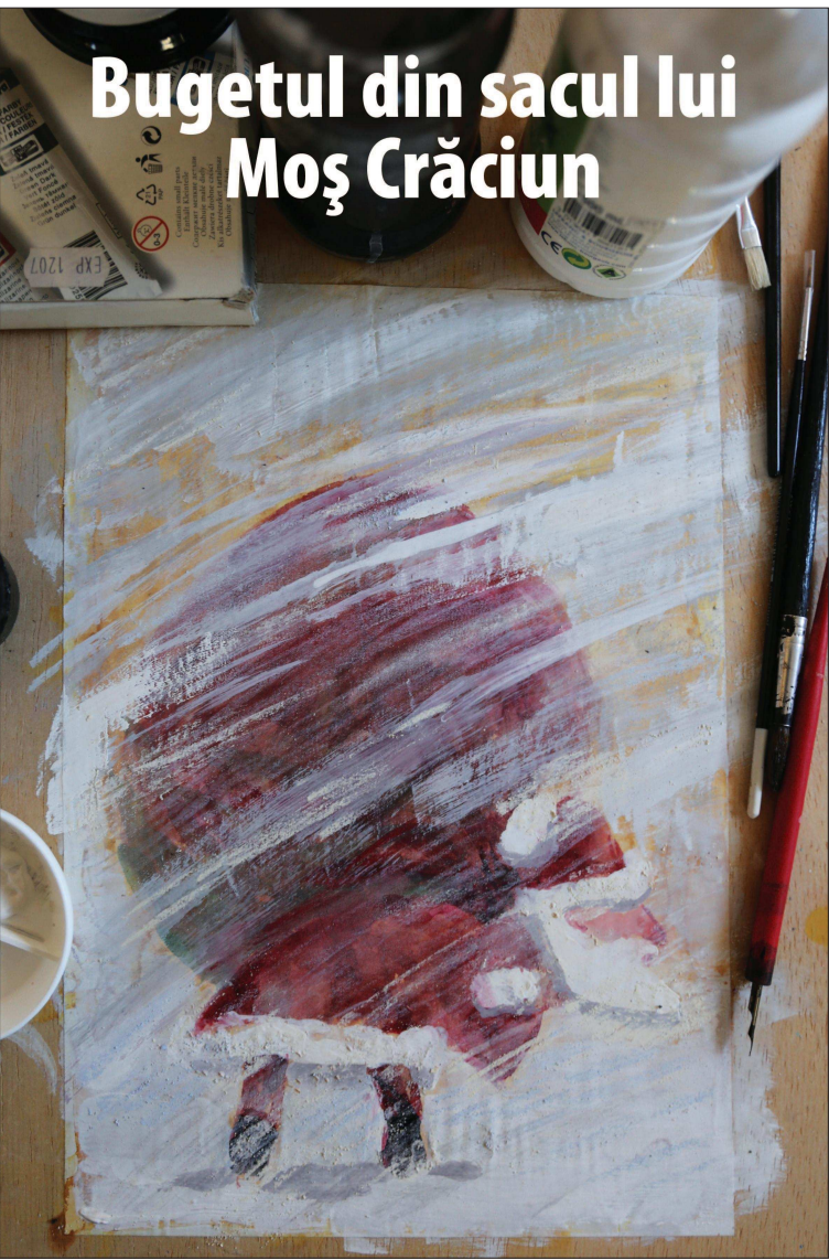
Ilustrație de MAKE

● La momentul actual, însă, nu se manifestă riscuri de natură severă, potrivit prim-vicegubernatorului băncii centrale Nivelul general de risc la adresa stabilității financiare din țara noastră este în creștere, similar evoluțiilor de pe plan global, conform prim-vicegubernatorului Băncii Naționale a României (BNR), Florin Georgescu, care menționează, însă, că la momentul actual nu se manifestă riscuri de natură severă.