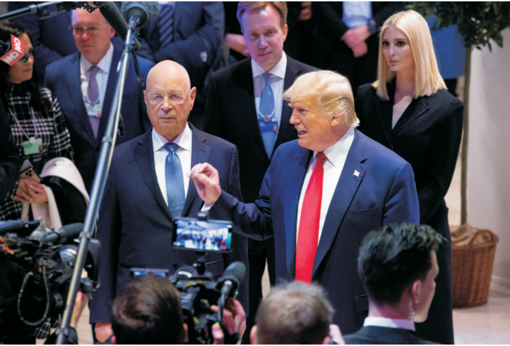
Donald Trump, președintele SUA, alături de Klaus Schwab, președintele executiv al Forumului Economic Mondial.