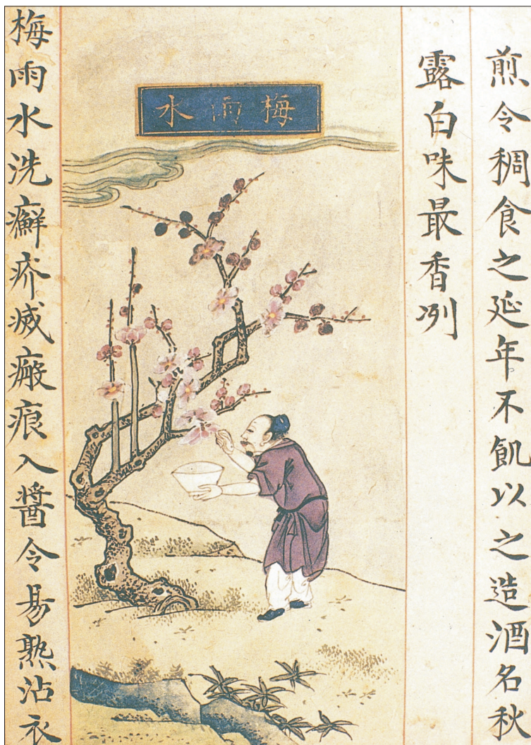
Încă din timpul dinastiei Ming (1368-1644), chinezii scriau tratate de medicină despre administrarea tratamentelor naturiste contra scabiei, prin decoctul ploii de prune a cărei preparare este ilustrată în imaginea pe care o reproducem. Ar fi de presupus că o astfel de practică de veacuri le conferă șansa să găsească un antidot la coronavirusul naturist sau oricum ar fi, dar să aibă eficiență.

● Banca Populară a Chinei: "Prăbușirea acțiunilor a avut elemente iraționale sau chiar de panică, declanșate de comportamentul de turmă" ● Beijing-ul acuză Statele Unite că răspândește panică, în ceea ce privește coronavirusul ● Piețele europene au încheiat ziua de ieri în creștere