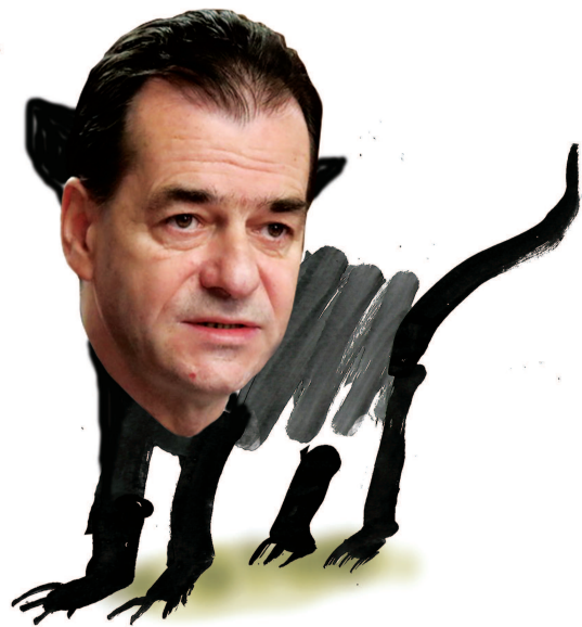
Ilustrație de MAKE

Orban, nici nu știți cât de mic începi să firi", a fost mesajul cu care liderul PSD, Marcel Ciolacu, și-a încheiat discursul înainte ca plenul Parlamentului să decidă cu 261 de voturi demiterea guvernului PNL, aprobând moțiunea de cenzură depusă de social-democrați și de reprezentanții UDMR. Împotriva motiunii s-au înregistrat doar 139 de voturi. Adoptarea acestui act mai înseamnă că primarii vor fi aleși în continuare în urma unui singur tur de scrutin.