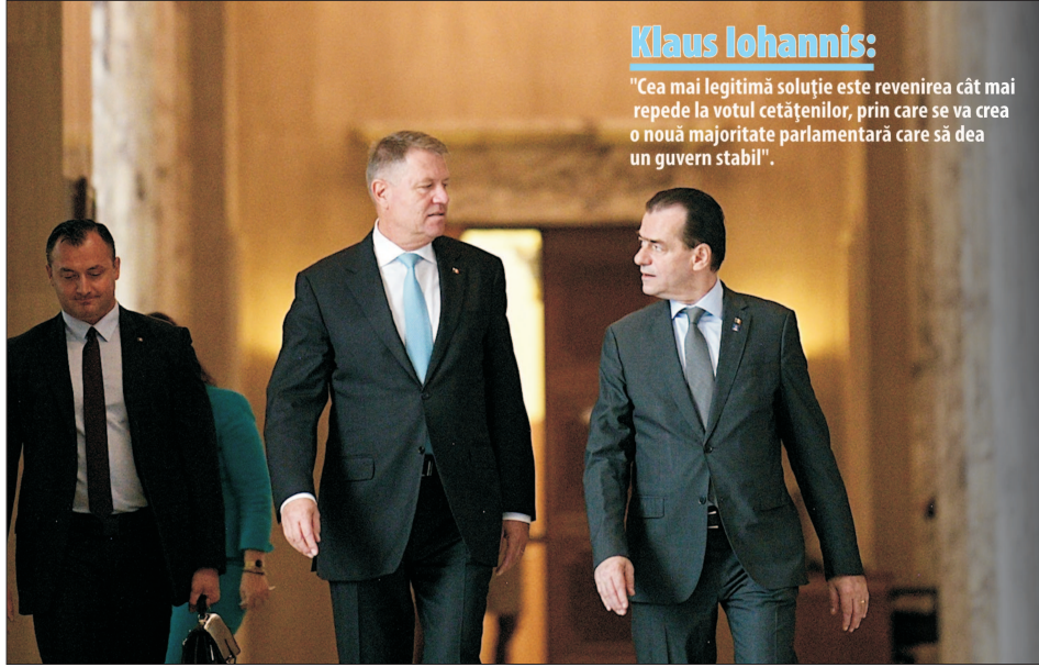
Klaus Iohannis: "Cea mai legitimă soluție este revenirea cât mai repede la votul cetățenilor, prin care se va crea o nouă majoritate parlamentară care să dea un guvern stabil".