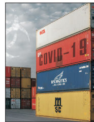
gereza maximului ratei infecțiilor.

Acum, pentru a spune că într-adevăr a venit primăvara, este nevoie de atin-