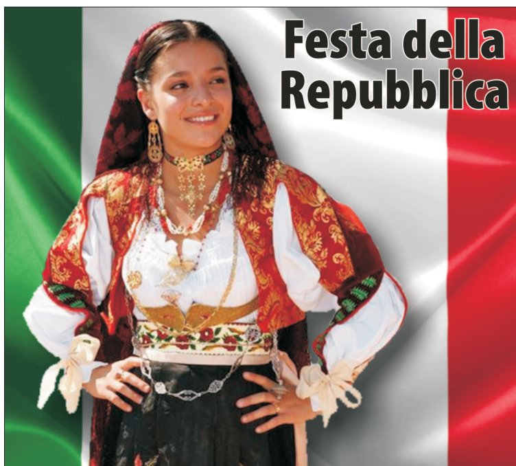
Gândim la fel, ne îmbrăcăm la fel - costum popular din Sardinia

D in păcate anul acesta nu putem celebra Sărbătoarea Națională, anul când împlinim 74 de ani de la referendumul care a marcat nașterea Republicii Italiene. Efectele virusului covid-19 sunt de altfel devastante și, date fiind pierderile de vieți omenești și daunele provocate economiilor mondiale, nu am putea avea, cu siguranță, dispoziția necesară – sau înzdrăcnala – de a sărbători, nu am putea să o facem nici măcar atrăgând atenția asupra măsurilor de distanțare socială, care împiedică adunările în grup. De mâine Italia intră într-o nouă etapă de luptă împotriva epidemiei. Aceasta nu este încă victoria finală: virusul nu a fost încă învins, dar măsurile adoptate și sacrificiile făcute de populație arată rezultate încurajatoare. Trebuie să continuăm să acordăm atenție maximă și să urmăm în fiecare țară indicațiile guvernelor pentru a preveni recrudescențe, dar, cu siguranță că nu este prea devreme să ne gândim – așa cum o facem concret – la victor, la termene care să poată depăși cele 14 zile de incubație care până acum ne-au marcat viața.