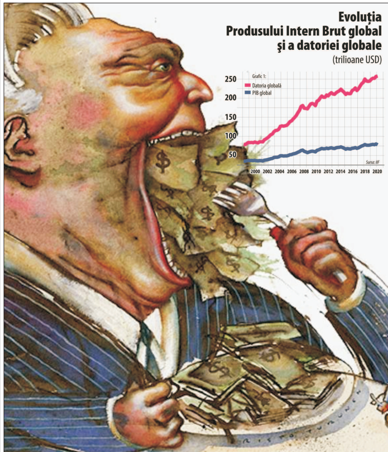
Evoluția Produsului Intern Brut global și a datoriei globale (trilioane USD)