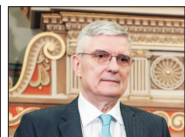
DANIEL DĂIANU, PREȘEDINTELE CONSILIULUI FISCAL:

de 233 de voturi necesare pentru dărâmarea Cabinetului Orban, chiar și în lipsa voturilor parlamentarilor UDMR, liderii PNL susțin că PSD nu a reușit să convingă parlamentarii neafiliați și nici pe cei mai mulți dintre reprezentanții minorităților naționale în Camera Deputaților.