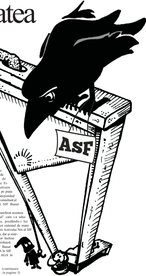
(continuare în pagina 3)