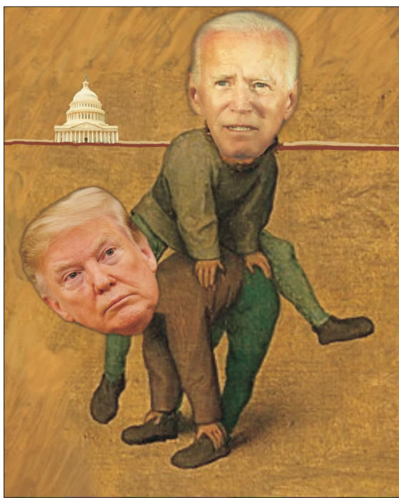
Colaj de MACE

Sâmbătă, 7 noiembrie, deși din punct de vedere tehnic alegerile prezidențiale din SUA trebuie confirmate de Colegiul Electoral din decembrie, mass-media a anunțat rezultatul.