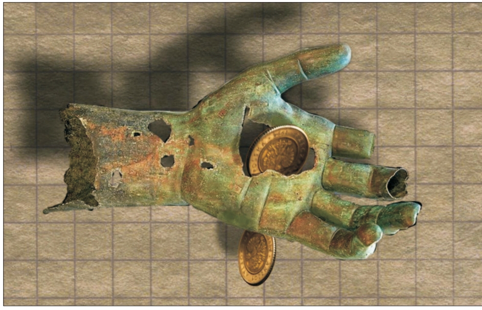
Ilustrație de MAKE

În primele luni din acest an datoria globală a crescut cu peste 15 trilioane de dolari față de sfârșitul anului trecut, până la circa 273 de trilioane de dolari, în timp ce economia globală a înregistrat o contracție de peste 5 trilioane de dolari, ajungând la 75 de trilioane de dolari, conform ultimului raport Global Debt Monitor de la Institute of International Finance (IIF)