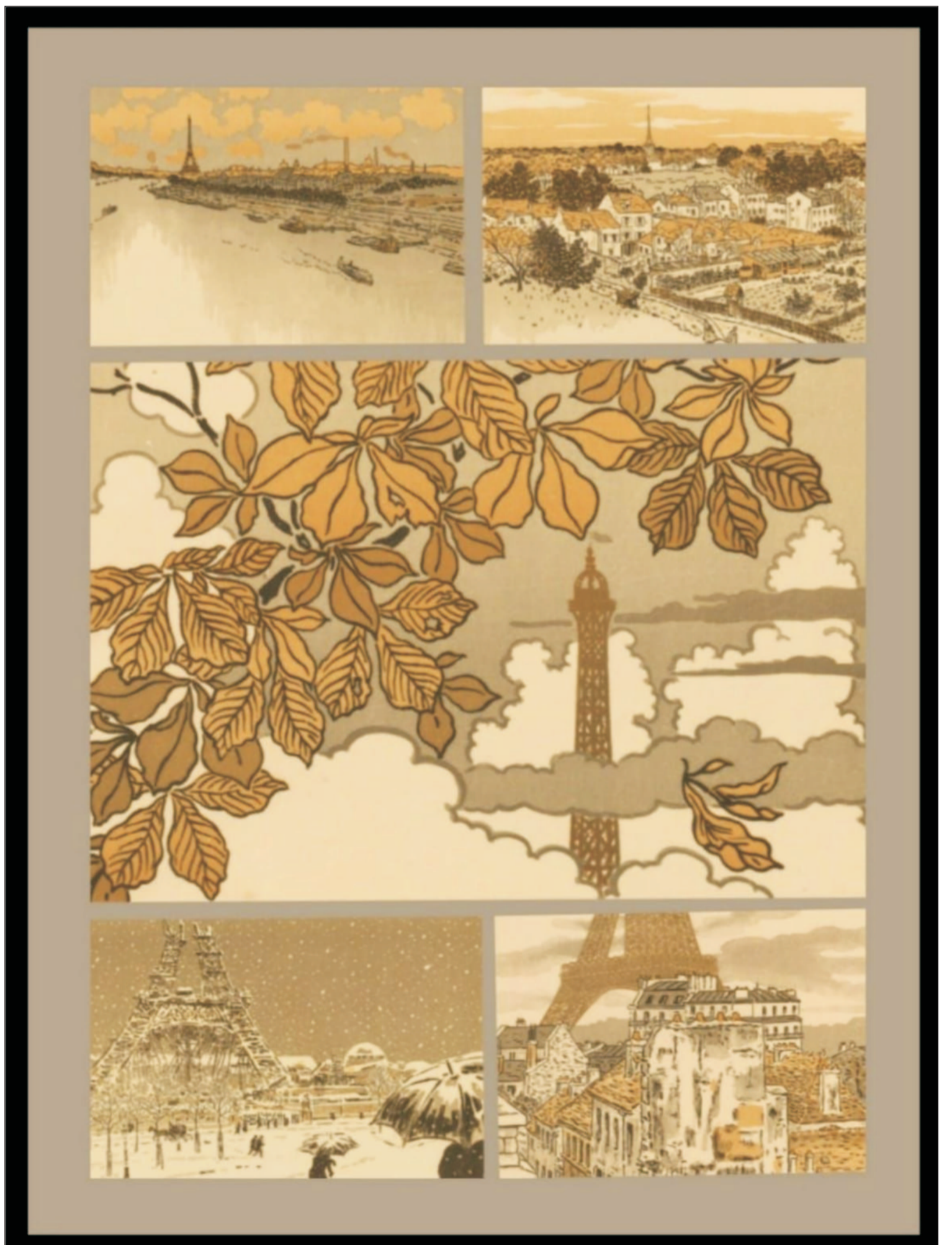
Henri Riviere (1864-1951), "Cele 36 de vederi ale Turnului Eiffel", litografii în cinci culori, 1902

Fransa este una dintre puținele țări din Europa care a preferat să aplice măsuri stricte de izolare totală și atunci când al doilea val al epidemiei a devenit suficient de puternic. Astfel că, începând cu 30 octombrie, declarația pe proprie răspundere, care trebuie să indice motivele în cazul deplasărilor (document adoptat mai ales în țările latine), a redevenit «literă de lege».