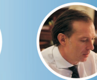
Florin Cițu propunerea PNL