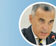
Călin Georgescu propunerea AUR

Consultările de la Palatul Cotroceni dintre președintele Klaus Iohannis și liderii partidelor parlamentare rezultate în urma alegerilor din 6 decembrie s-au încheiat, ieri, așa cum au început: fără nicio decizie. Patru premieri au fost propuși lui Klaus Iohannis - Alexandru Rafila, Florin Cițu, Dacian Ciolos și Călin Georgescu - dar niciunul nu a primit girul din partea președintelui țării, pentru că niciuna dintre formațiunile politice parlamentare nu a prezentat constituirea