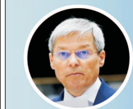
Dacian Ciolos propunerea USRPLUS