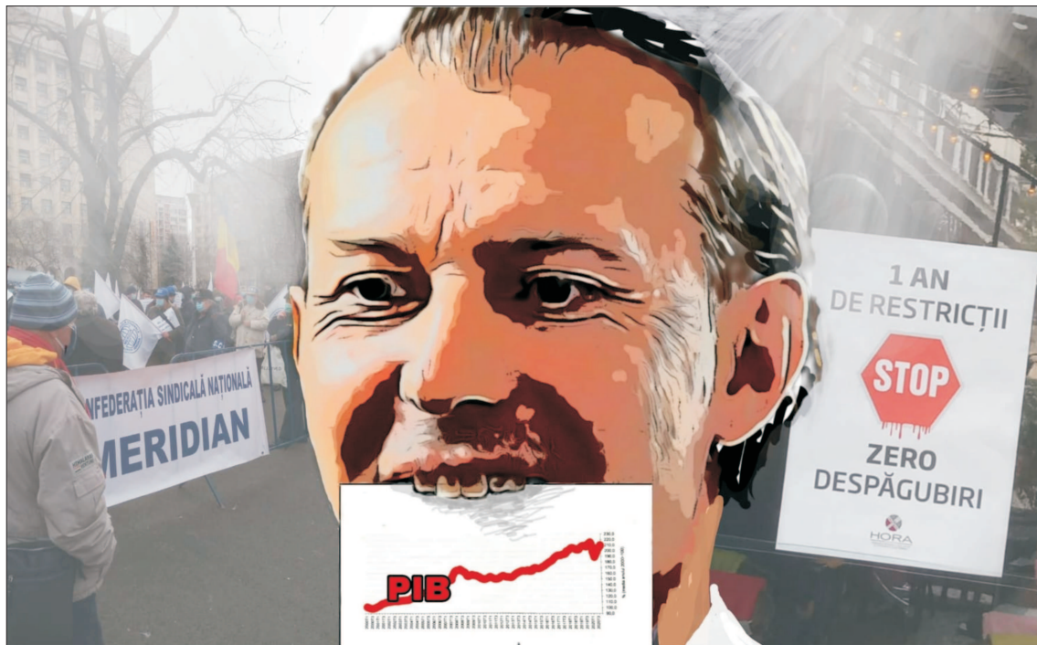
Ilustrație de MAKE

GRAM AUR = 235,0808 RON FRANC ELVEȚIAN = 4,5147 RON EURO = 4,8747 RON DOLAR = 4,0073 RON