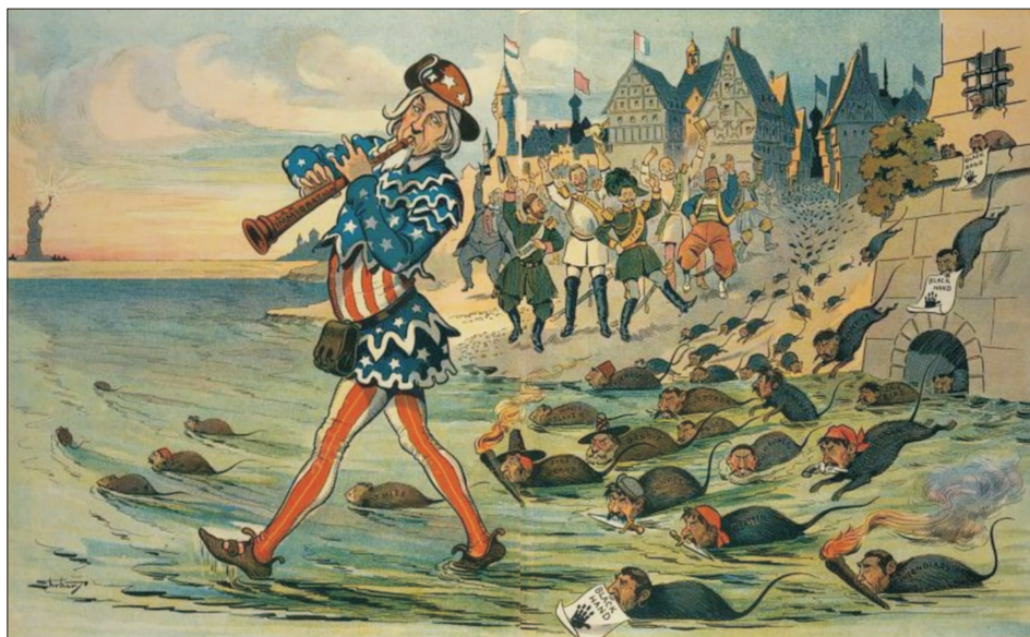
Acestă imagine, păstrată în Biblioteca Congresului American, a fost concepută în anul 1909, ca parte a propagandei americane...

Țărilor mai sărace le va fi greu să se adapteze la dobânzi în creștere și la dolarul puternic