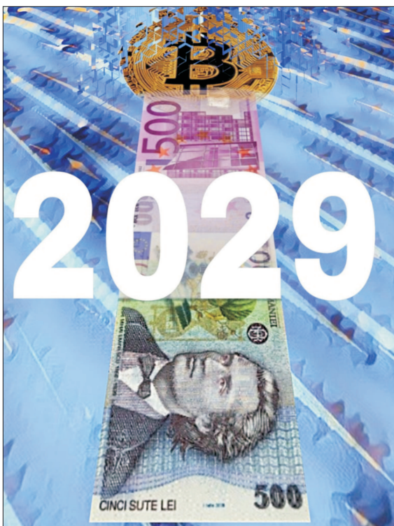
Grafică de MAKE