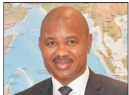
Excellența Sa Jabu Mbalula, Ambasadorul Republicii Africa de Sud în România

27 DE ANI DE LIBERTATE ÎN AFRICA DE SUD În 1994, în frunte cu președintele Nelson Mandela, am început să construim o țară democratică