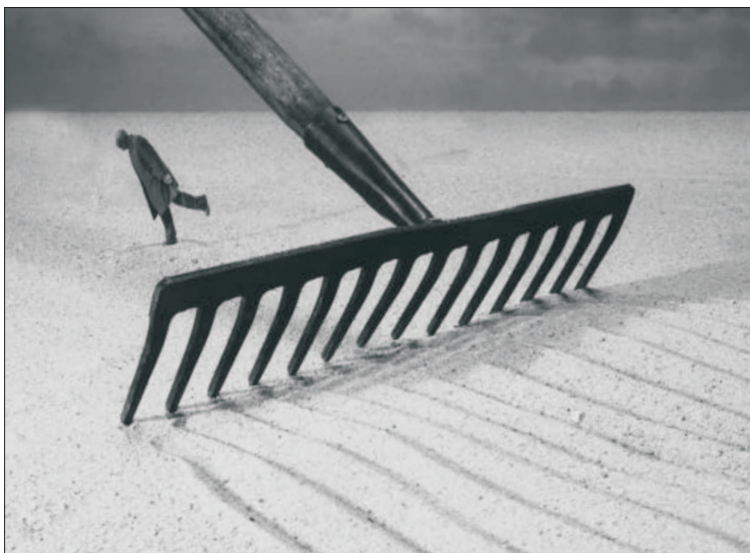
Gilbert Garcin - Toamna

● Prețurile pe piața electricității - în continuă creștere ● Experți: România se află într-o criză de generare de energie