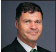
(continuare în pagina 2)

„Bursa nu este doar un canal de finanțare, ci și o platformă care îi oferă unei companii vizibilitate” Douăsprezece listări de acțiuni au fost realizate până acum în acest an la Bursa de Valori București (BVB), iar până la sfârșitul anului se așteaptă o dublare a acestor cifre, a precizat Radu Hanga, președintele operațional al pieței noastre de capital. Domnia sa a spus: „Vedem proiecte care vin către Bursa de Valori București și caută finanțare. La începutul anului spunem că așteptăm 20 de listări de acțiuni și obligațiuni. Până acum s-au realizat douăsprezece listări de acțiuni și încă cincisprezece listări de acțiuni și titluri de stat. Am depășit ceea ce preconizăm pentru acest an și, dacă ne uităm la proiectele care sunt în derulare acum la broker, ne așteptăm ca cifra cel puțin să se dubleze, până la sfârșitul anului.” Radu Hanga a adăugat: „Vedem piața AeRO crescând foarte mult. Bursa de Valori București administrează două platforme. Pe de o parte este Piața Principală, care se adresează companiilor mature, companiilor mari și aici vorbim despre cele mai importante companii din economia românească. Și pe de altă parte avem piața AeRO, lansată în urmă cu câțiva ani, care este o piață de creștere, ce se adresează companiilor mai mici, aflate într-un stadiu incipient de dezvoltare. (A.L.)”