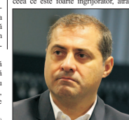
(continuare în pagina 3)