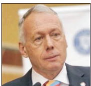
V.R. (continuare în pagina 4)

Țara noastră nu stă bine la capitolul dezvoltare durabilă, fiind pe ultimele locuri la nivel european, potrivit domnului Laszlo Borbely, consilier de Stat la Cabinetul Prim-Ministrului, coordonator al Departamentului de Dezvoltare Durabilă din cadrul Secretariatului General al Guvernului, care aduce în atenție faptul că educația este domeniul la care România stă cel mai prost. Oficialul guvernamental afirmă: „Avem o strategie de dezvoltare durabilă a României din 2018, cu ținte și obiective pentru 2020 și 2030. Împreună cu Institutul Național de Statistică am făcut o analiză pe baza a 98 de indicatori, un inventar al studiului în care se află strategia de dezvoltare durabilă. Concluzia este că nu stăm foarte bine. Menționăm că, spre exemplu, analistul economic american Jeffrey Sachs și echipa sa fac un grafic în fiecare an despre cum evoluează 167 de state din lume în privința dezvoltării durabile. România este pe un onorabil loc 39, suntem în apropierea Statelor Unite ale Americii, dar asta nu înseamnă că stăm bine. Sunt unele zone gri, pentru care nu au date.”