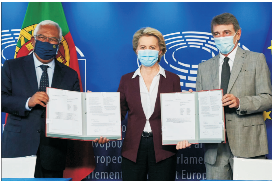
Antonio Costa, Ursula von der Leyen și David Sassoli, în momentul semnării de colegiitori a regulamentului privind introducerea certificatului digital Covid-19.