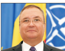
Nicolae Ciuică 54 de ani, general în rezervă, fost ministru al apărării naționale în guvernările Orban, premier interimar în perioada 7-23 decembrie 2020, ministru al apărării naționale în guvernul Ciu, după 23 decembrie 2020. (continuare în pagina 3)