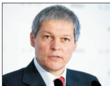
Dacian Cioloș 52 de ani, deputat european, președinte al USR, fost președinte al Renew Europe. Între 17 noiembrie 2015 și 4 ianuarie 2017 a fost prim-ministru al Cabinetului de tehnocrați care a condus jura după dezastrul de la Colectiv. (continuare în pagina 3)