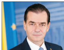
Ludovic Orban 58 de ani, președintele Camerei Deputaților, fost președinte al PNL. Prim-ministru în perioada 4 noiembrie 2019-7 decembrie 2020. (continuare în pagina 3)

USR, acția din urmă îl vor propune pentru funcția de prim-ministru pe Dacian Cioloș, proșpag demisionar din funcția de președinte al grupului politic Renew Europe din Parlamentul European și președinte al USR.