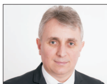
Lucian Bode 46 de ani, ministru de interne, ministru interimar al Justiției (după revocarea din funcție la 1 septembrie a lui Stefan Ion), fost ministru al transporturilor în guvernările Orban. (continuare în pagina 3)