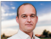
Dan Vilceanu 42 de ani, deputat, secretar general al PNL, ministru interimar al finanțelor publice și ministru interimar al transporturilor și infrastructurii. (continuare în pagina 3)