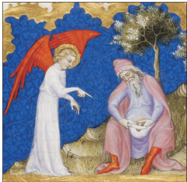
Circumcizia lui Avraam, miniatură din Biblia Jean de Sy (cca. 1355-1357)

JUSTIȚIE ȘI REVOLUȚIE, APROPO DE HOMOSEXUALITATE