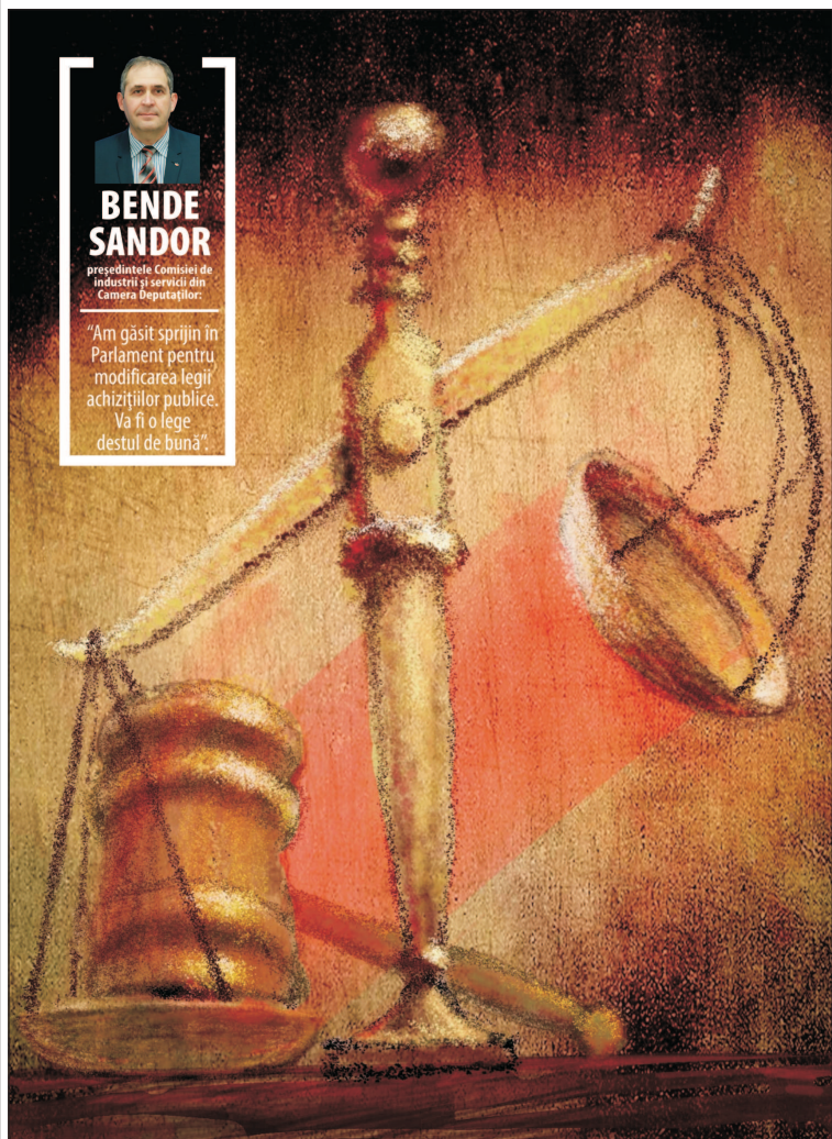
Grafică de MAKE

Mediul de afaceri a resimțit nevoia unei resesări, în această perioadă, și își dorește ca autoritățile centrale și decidenții politici să îl lase să își desfășoare activitățile, și nu să-l încurce prin modificări fiscale și legisla-