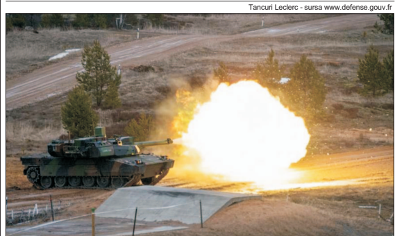
Tancuri Leclerc