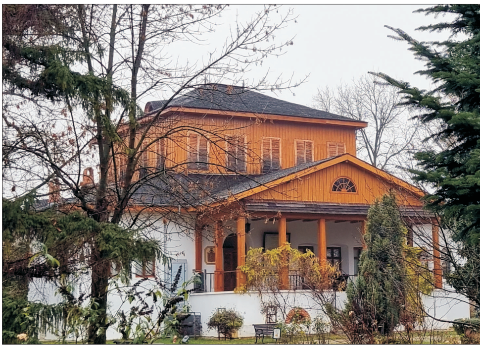
Conacul Goleștilor unde a pictat Nicolae Grigorescu

L a Hong Kong, în licitația "20th și Century Art Evening Sale" din data de 30 noiembrie de acolo, s-a vândut "Degenerare Art", o pictură de Adrian Ghenie, cu 36,850 milioane de HKD, adică dolari Hong Kong, ceea ce înseamnă 7,1 milioane de euro sau 7,5 milioane de dolari americani. După nume, artiștii pare a fi român. Glumim, de sigur, este chiar Adrian Ghenie, tânărul și impenetrabil pictor român care ne uimește, de ceva ani, cu vânzări de milioane la mari case internaționale și la licitațiile pe care acele organizații le fac pe tot în lume. Hong Kong a devenit locul preferat pentru vânzările recente ale picturilor lui Adrian Ghenie. Vânzarea