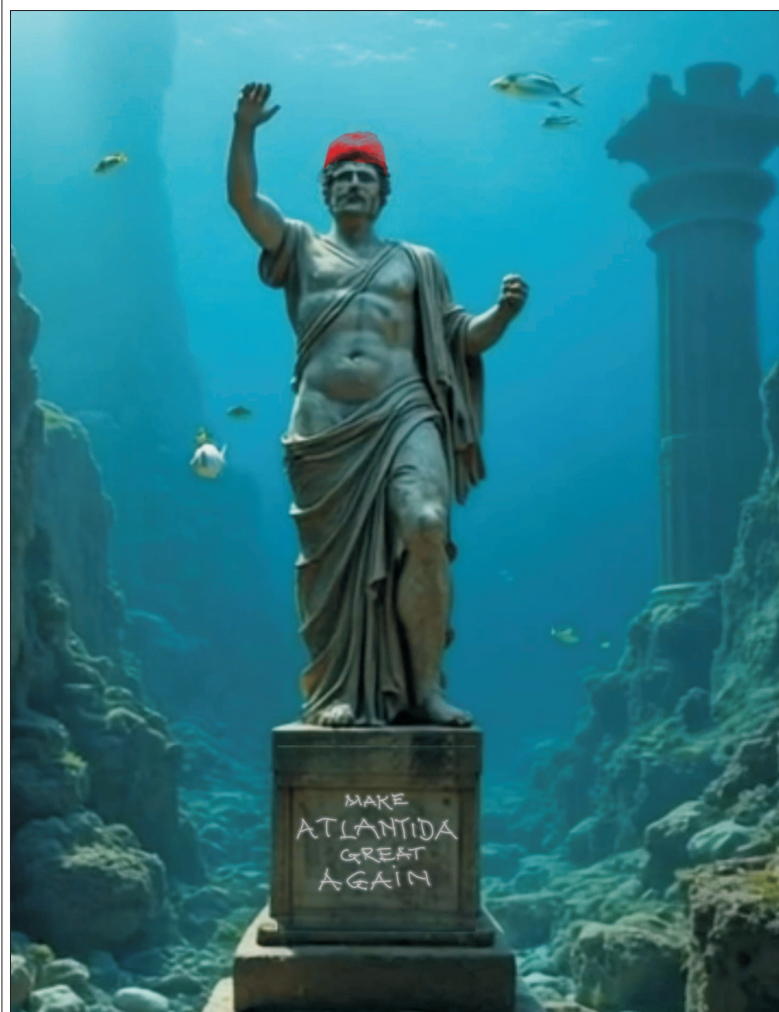
Ilustrație concepută de MAKE